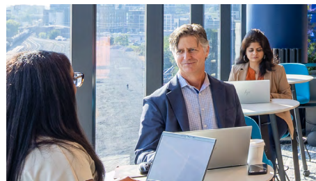
Sociedad en Comandita Simple (S.C.)

Las obligaciones sociales están garantizadas por un capital determinado en el que los socios están comprometidos con el valor de su aporte — representado en acciones —.