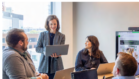
Compañía Anónima (C.A. / S.A.)

En la actualidad, los tipos societarios comúnmente utilizados en Venezuela son los siguientes: