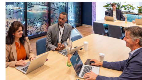
Sociedad en Comandita por Acciones (S.C.A.)

En este tipo de sociedad, los socios responden solidaria y de forma ilimitada de las obligaciones sociales.