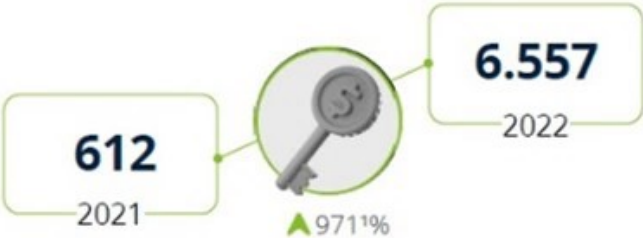
Quantidade de usuário único Pessoa Física para doação dos dados (em mil)