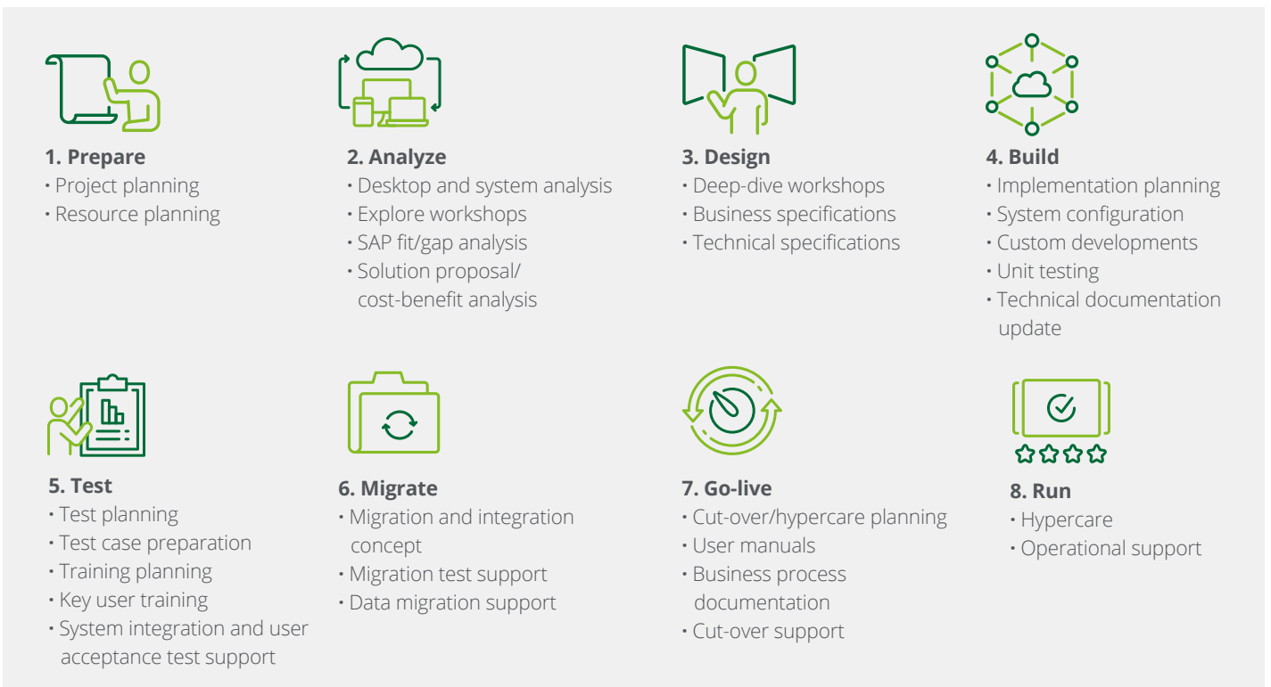
Abb. 2 - Adaptierbares Vorgehensmodell

wir als Deloitte eine ganzheitliche Unterstützung während sämtlicher Projektphasen anbieten können. Unser Dienstleistungsspektrum erstreckt sich dabei von der reinen Beratung, über die Implementierung der Standardlösung und der Entwicklung kundenspezifischer Lösungen bis hin zum operativen Betrieb.