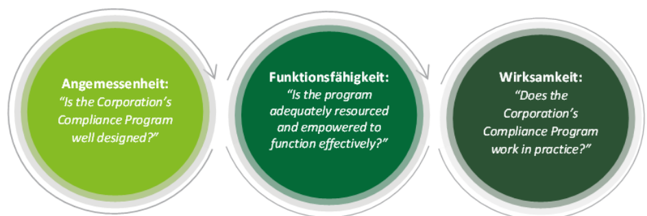
Abbildung 1: Drei fundamentale Fragen zum CMS

Um das Unternehmen sowie das Management vor finanziellen Schäden, Reputations- oder Haftungsrisiken systematisch und zugleich wirksam zu schützen und ein Compliance Monitorship erfolgreich zu umgehen, empfiehlt es sich, das CMS von Anfang an nach bekannten Standards zu entwickeln und zu implementieren. Das DOJ bietet in diesem Kontext einen Orientierungsrahmen durch die Entwicklung und Veröffentlichung eines Leitfadens zur Bewertung der Compliance-Programme von Unternehmen („Evaluation of Corporate Compliance Programs“). Dieser dient allen strafrechtlichen Ermittlungsverfahren des DOJ und gibt darüber hinaus Einblicke und Hinweise darauf, wie ein CMS idealerweise ausgestaltet sein sollte, und zwar basierend auf drei fundamentalen Fragestellungen (s. Abbildung 1).