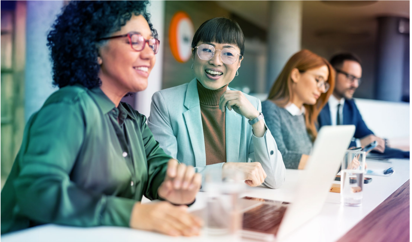
Abb. 3 – Der Wert von Enterprise Business Planning