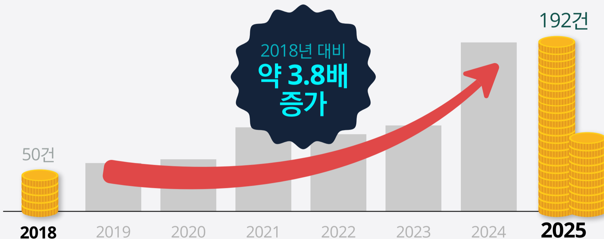
글로벌 스포츠 산업 분야 사모펀드 거래량 증가세

글로벌 스포츠 산업 분야에서, 사모펀드 등 기관 자본의 투자 거래량이 증가세를 보이고 있으며, 재무적 엄격성·투명성·운영 전문성이 핵심 경쟁 우위 요인으로 부상