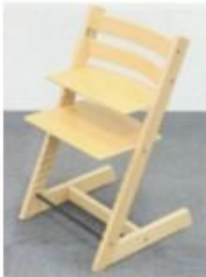
【本件椅子】（上告人側）

これに対し、被上告人側は、本件椅子のような実用品の形状は、原則として著作権法の保護対象ではないこと、仮に保護対象だとしても、本件椅子と被上告人側製品は全く異なるものであり、著作権侵害にあたらないと反論しました。