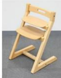
【被上告人側製品】（被上告人側）