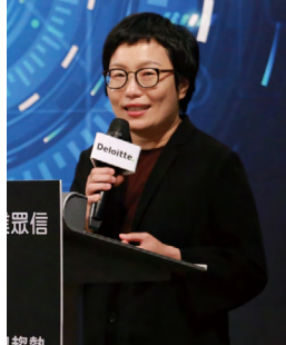
文化部政務次長丁曉菁。

文化部政務次長丁曉菁致詞時表示，在數位匯流時代，銷售通路多元分眾，產業已經走入全新的發展方向。然而，文化產業卻面臨生態系破碎與不完整的問題，致使投資者信心缺乏，昨天行政院各部會已宣布國家政策工具到位，主要希望透過國發基金的投資，宣示台灣政府對於 OTT 產業的重視，引領企業與投資者隨之進場，相信透過勤業眾信的協助，將能重新拉近投資者與 OTT 產業的距離，驅動文化產業升級。