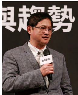
和碩聯合科技董事長童子賢。

和碩聯合科技董事長童子賢致詞時表示，在這波新趨勢之下，規則會被打破、疆界會被模糊、法規與稅收模式也在改變，因此新的時代需要新的獲利方式。如果一個經濟體無能力面對新的產業規則，則會落後市場，對於 OTT 產業而言，現在是結合網路經驗的好時機，讓整個影音產業發展有新的方向。