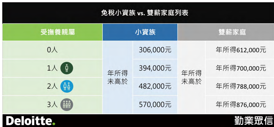
圖四：免稅小資族 vs. 雙薪家庭列表

往後每多申報一個撫養親屬，即可再享有88,000元免稅額，若受撫養年滿70歲的直系尊親屬，可再多減除44,000元免稅額。（見圖四）