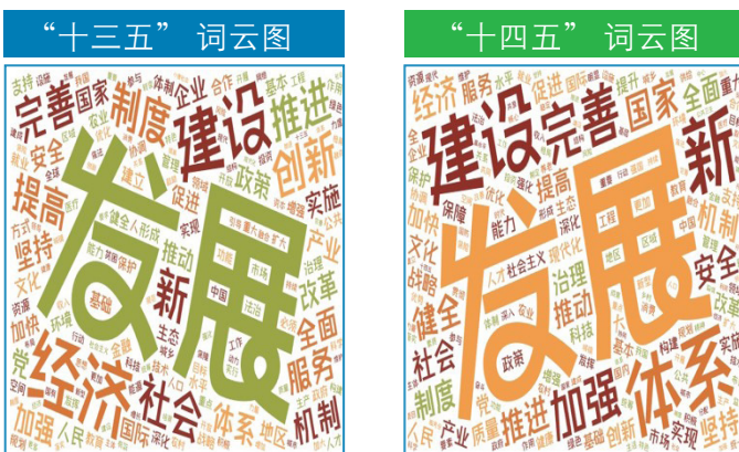
图1：《十三五规划建议》与《十四五规划建议》词频云图对比

与十三五规划建议相比，本次《建议》中“新”字的频率明显提升（参见图1），预示着未来中国的经济和社会发展走向将出现变化。其次，本次《建议》文件并没有频繁地提到“经济”本身这个词汇，而是更加分散地强调在多个细微领域的调整和加强，例如对制度的完善以及对产业体系的健全。这刚好符合首次在建议中出现的“坚持系统观念”原则，要求对发展的质量、结构、规模、速度、效益、安全实现统一。第三，《建议》着重强调了“安全”，充分展示了中国政府对于防范风险的重视，彰显了底线思维的重要性。最后，十三五建议中多次提及创新，但本次文件中，科技与创新成为了同样高频的词汇，显示出了中国政府对于在新阶段，对于科技创新的重视。