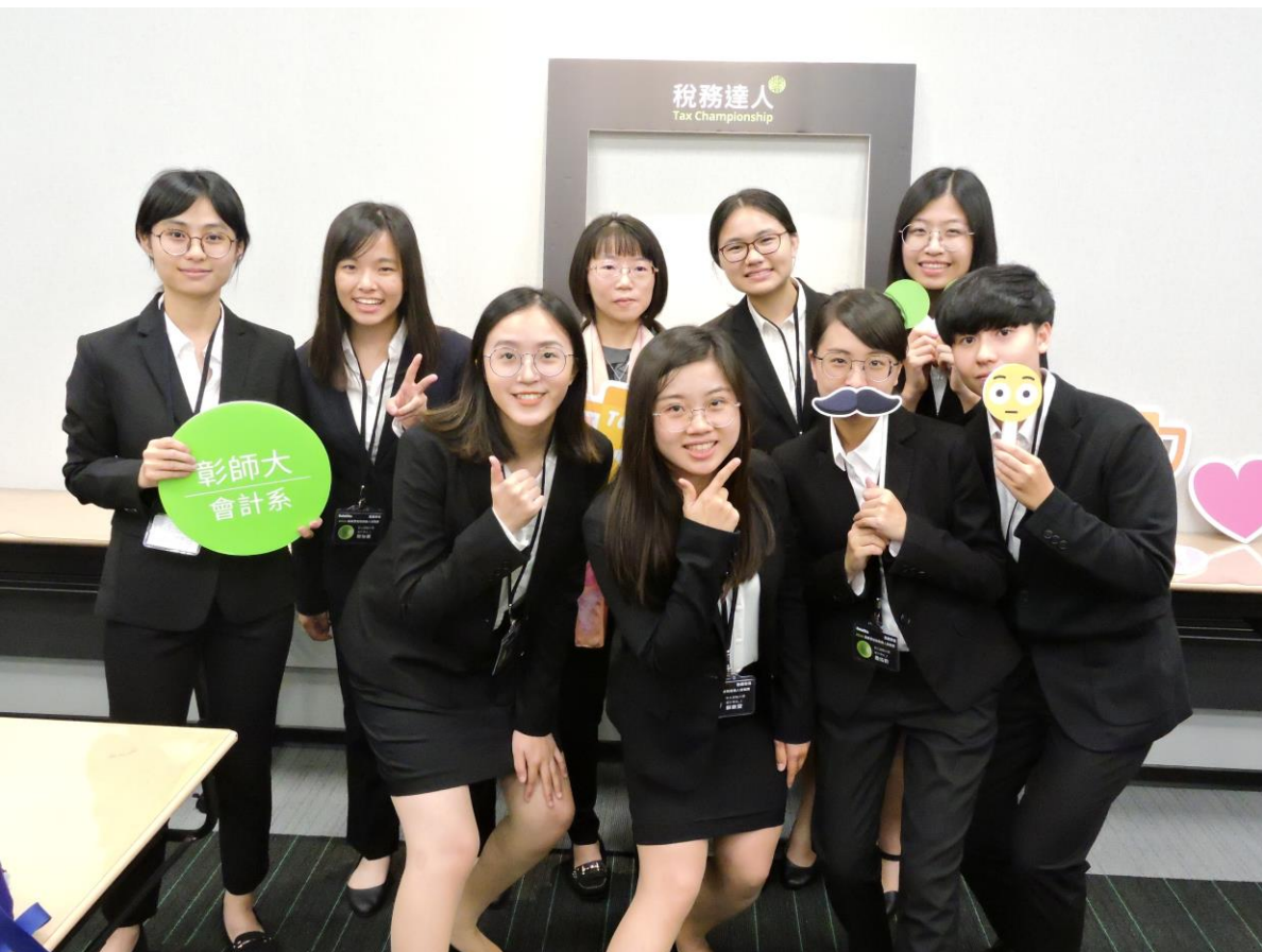
勤業眾信版權所有 保留一切權利