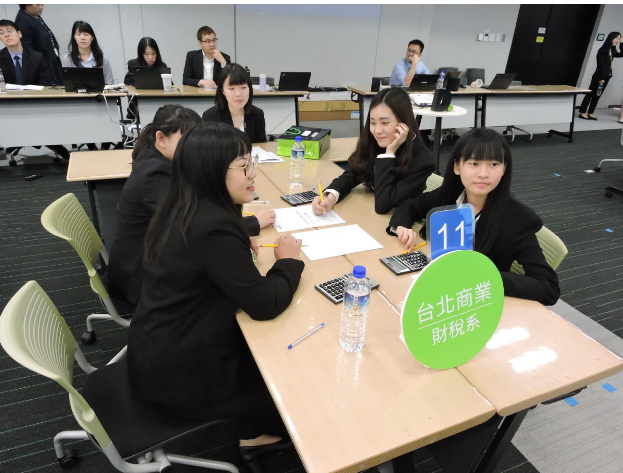
勤業眾信版權所有 保留一切權利