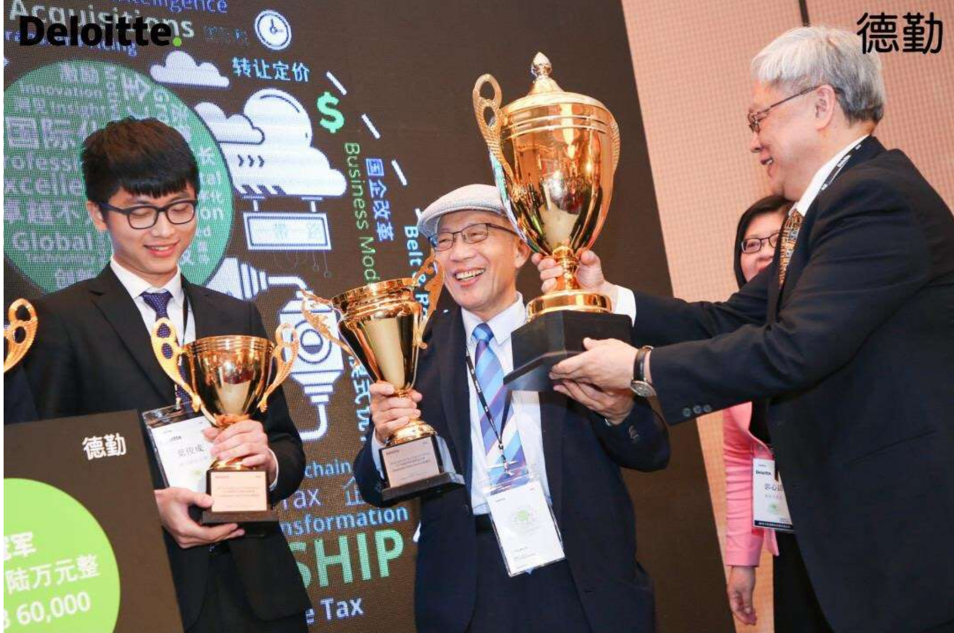
2018年度德勤税务精英挑战赛全国比赛 修德 勤思，智创未来