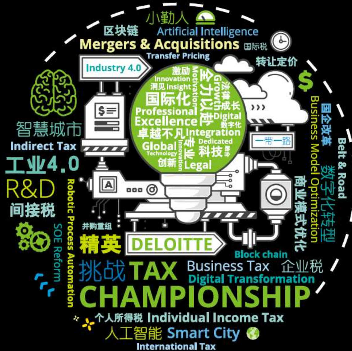
2018德勤稅務精英挑戰賽 決賽花絮照片