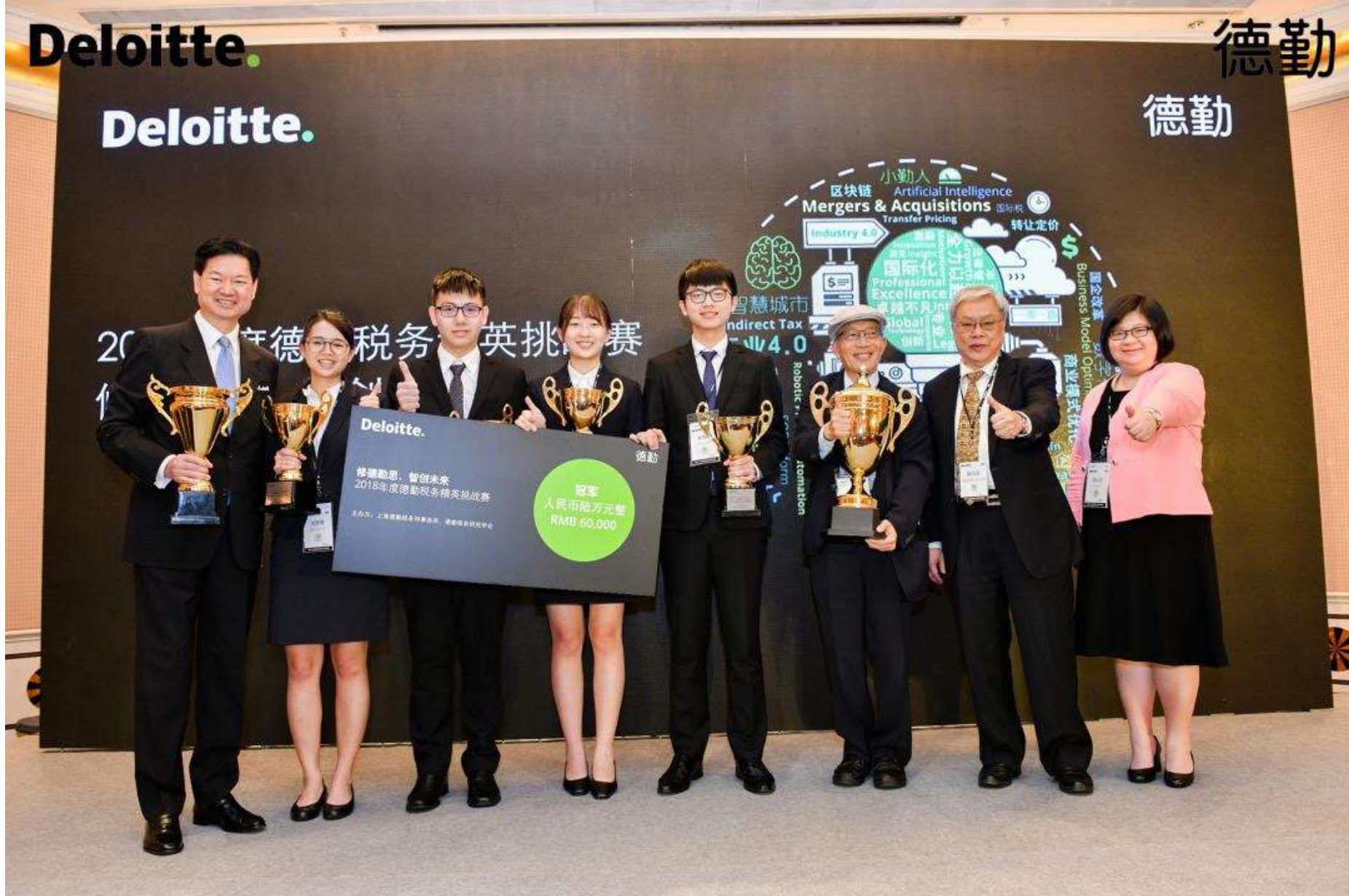
2018年度德勤税务精英挑战赛全国比赛 修德勤 思，智创未来