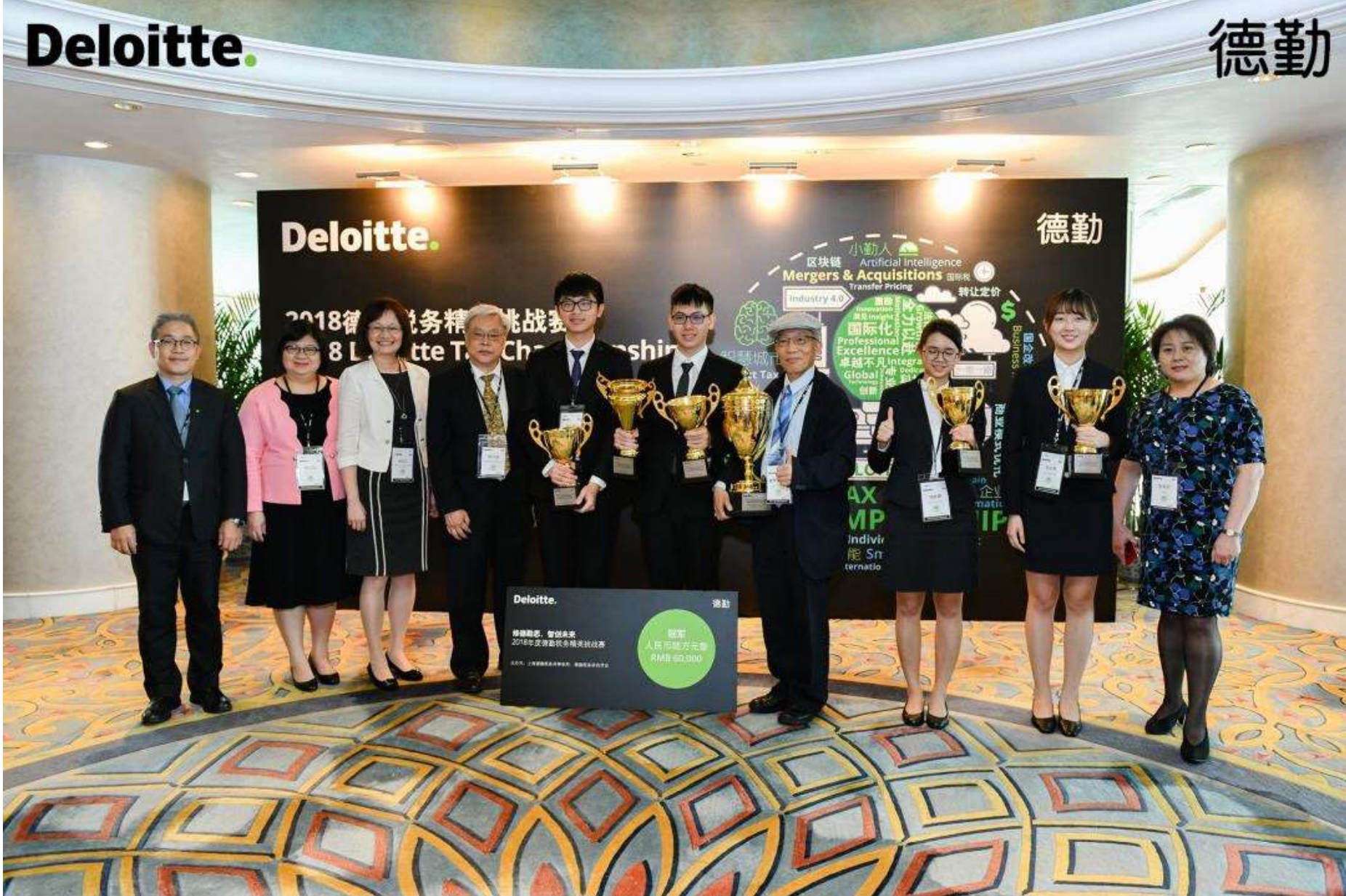
2018年度德勤税务精英挑战赛全国比赛 修德勤 思，智创未来