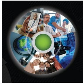
2023 醫療照護產業展望