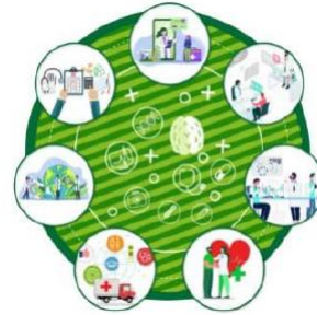
2022 年生命科技產業展望