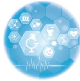
2022 生醫合作交易白皮書