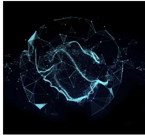
上雲解鎖醫療照護組織的創新轉型