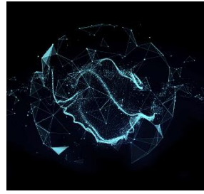
上雲解鎖醫療照護組織的創新轉型