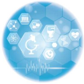
2022 生醫合作交易白皮書