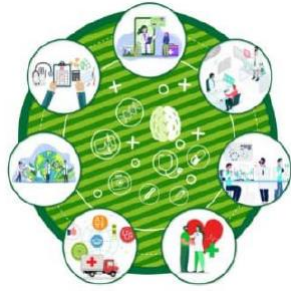
2022 年生命科技產業展望