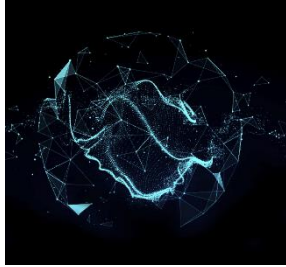
上雲解鎖醫療照護組織的創新轉型