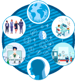
2022 醫療照護產業展望