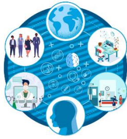
2022 醫療照護產業展望