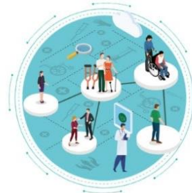
2021 醫療照護趨勢展望