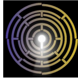
2021 生醫合作交易白皮書