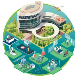
生醫 x 人工智慧調查白皮書