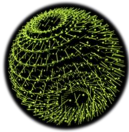
2020 醫療照護產業展望