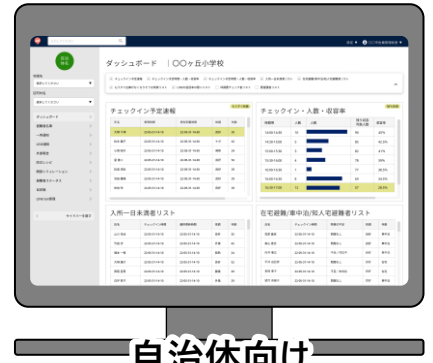
自治体向け ダッシュボード