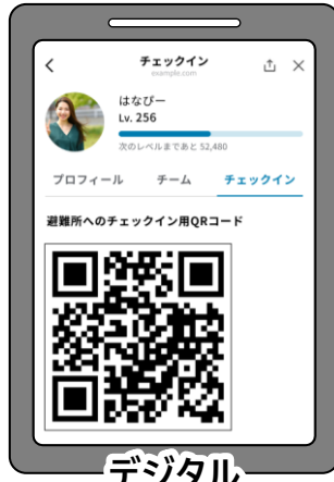
デジタル 避難所チェックイン