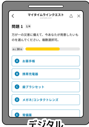
デジタル マイタイムライン