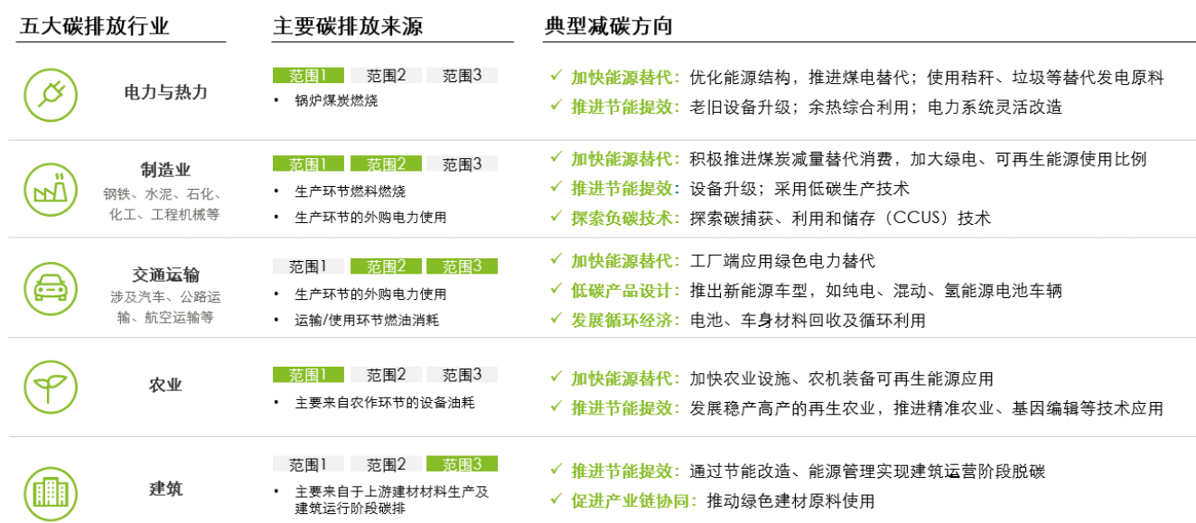
图表 6：重点行业在减碳方向中的侧重点及主要举措

在德勤服务的大量的客户服务案例中，我们观察到各不同行业的碳排分布不同，在减碳路径选择中的侧重方向亦有所差异（见图 6）。