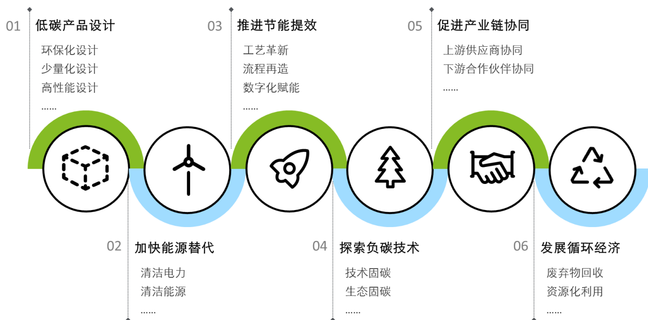
图表 5：企业低碳转型六大方向