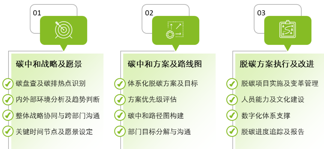
图表 4：企业科学减碳三大行动步骤

低碳业务转型的实质是对于企业资源的有效重组，进而实现企业的长期价值。根据德勤《2022 年全球首席战略官调研》，有超过 70% 的受访者表示可持续发展是企业的关注重点 [5] ，另据《2022 年德勤高管可持续发展报告》显示，近三分之一的受访者表示可持续发展的行动落实仍存在障碍，企业不清楚如何制定自身的降碳目标及路径图，实现科学减碳 [6] 。德勤认为，企业可采取三步走的方式推进自身碳中和的愿景达成：即基于碳足迹盘查的碳中和战略与愿景设计、立足脱碳热点分析脱碳方案及路线图制定，以及系统化的脱碳方案执行及改进（见图表 4）。