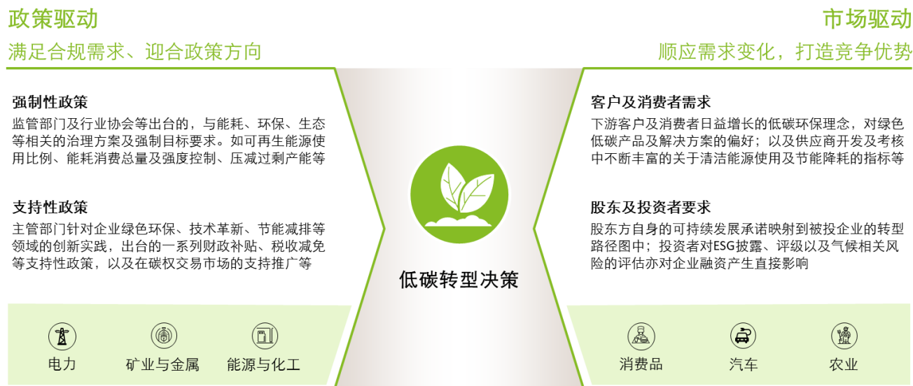
图表 3：低碳转型的核心驱动要素及行业举例

应该说，可持续发展及绿色减碳已成为各行业的社会共识，内外部利益相关方对企业的低碳承诺及行动落实持续施加影响。根据德勤 2021 气候行动调查的结果，监管端和市场端的压力是驱动企业布局低碳转型的两大关键因素 [4] 。前者包含了强制类政策及支持类政策，体现为自上而下的规范性引导，确保重点行业能满足基本的合规需求，确保整体减排目标的达成；而后者则主要来自于客户及消费者日趋增长的绿色环保诉求，即自下而上的需求驱动，以打造更具韧性的绿色业务组合，形成新的企业竞争优势，并满足资本市场与投资者的长期要求（见图表 3）。