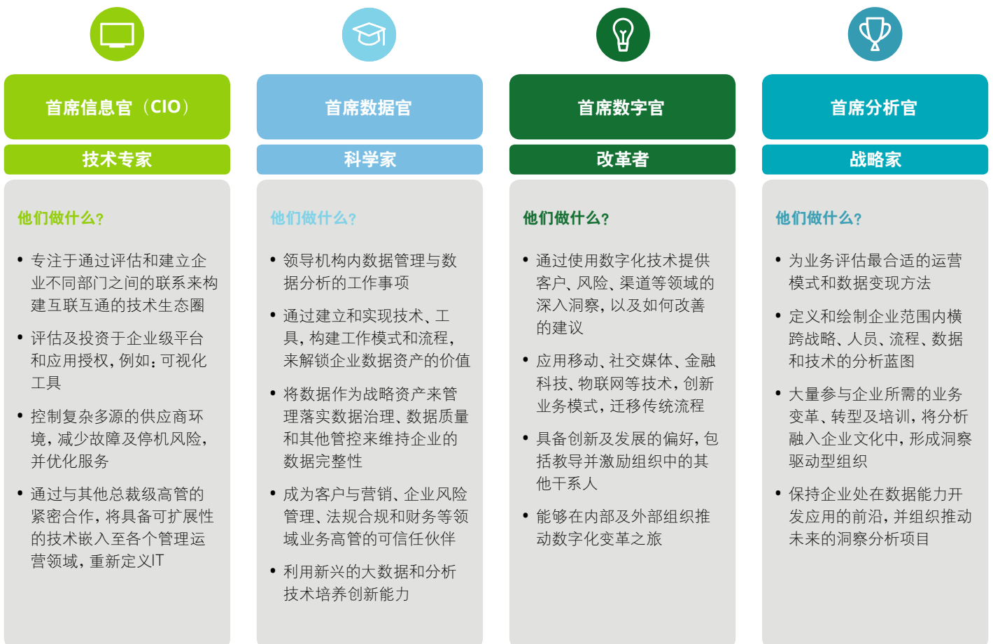
图1：各个角色的总览及区别 1

在对全球金融企业组织结构的大量调查研究中，我们发现金融企业组织中存在大量以数据为工作重点，或者工作职责依赖于数据的总裁级高管职位（如图 1 所示）。因此，我们有必要来了解这些角色和首席数据官有何不同。