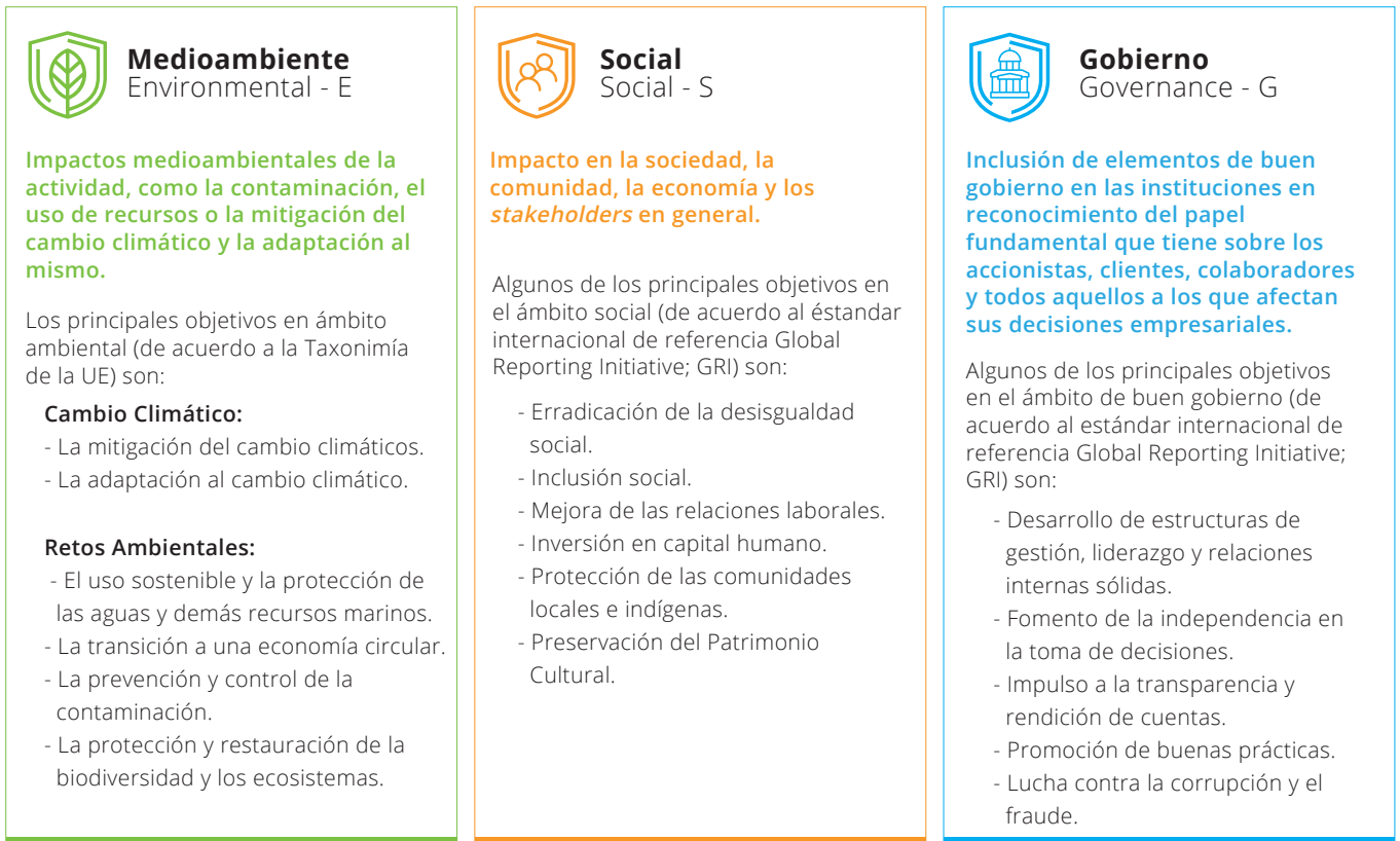
Esquema del marco de los principios ESG.

Entrando en materia específica de evaluación, existen algunas guías sobre aspectos mínimos a considerar en cada frente. Por ejemplo, en el Instituto de Auditores Internos a través de su publicación "AI y aspectos ESG" define los siguientes ámbitos de evaluación para cada Pilar: