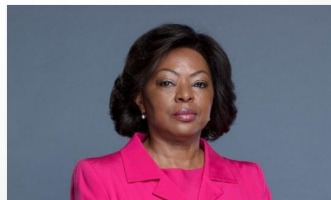
Sua Excelência Primeira Dama, Ana Dias Lourenço Presidente do Júri

Os Prémios SIRIUS serão atribuídos mediante a avaliação dos nomeados pelo Júri, isento, independente e de indiscutível credibilidade.