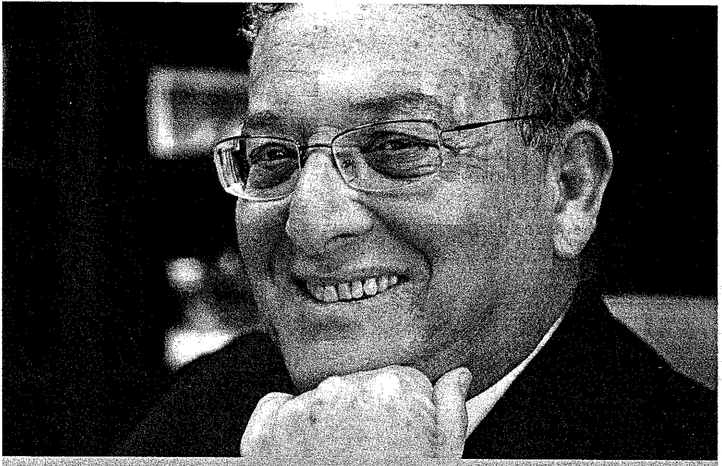
בריטמן. "מבליטות את השימור"