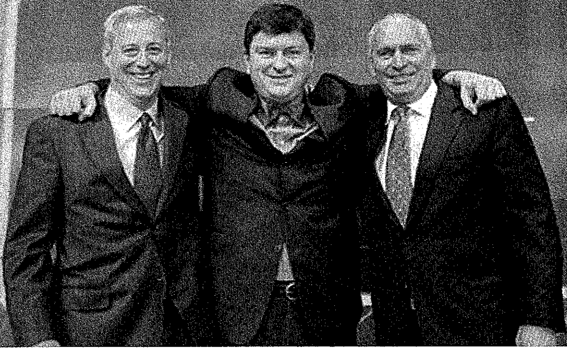
ההנפקה של שופינג.קום. השוואת מחירים בשוק האמריקני

Shopping.Com NASDAQ Listed [SHOP] 10.26.04