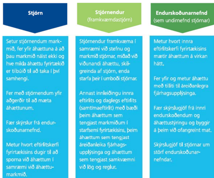
Mynd 4. Verkefnaskipting á milli yfirstjórnar